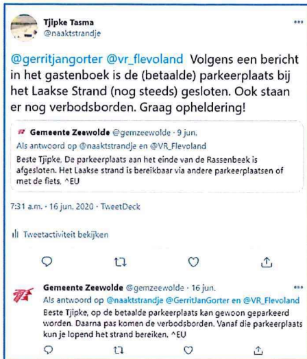
Figuur 2 Twitter reactie gemeente Zeewolde 9 en 16 juni.

Uit meldingen in het gastenboek op mijn site en ook uit eigen waarneming is vastgesteld dat de parkeerplaats onbereikbaar is geweest gedurende het hele strandseizoen, zie Figuur 3.