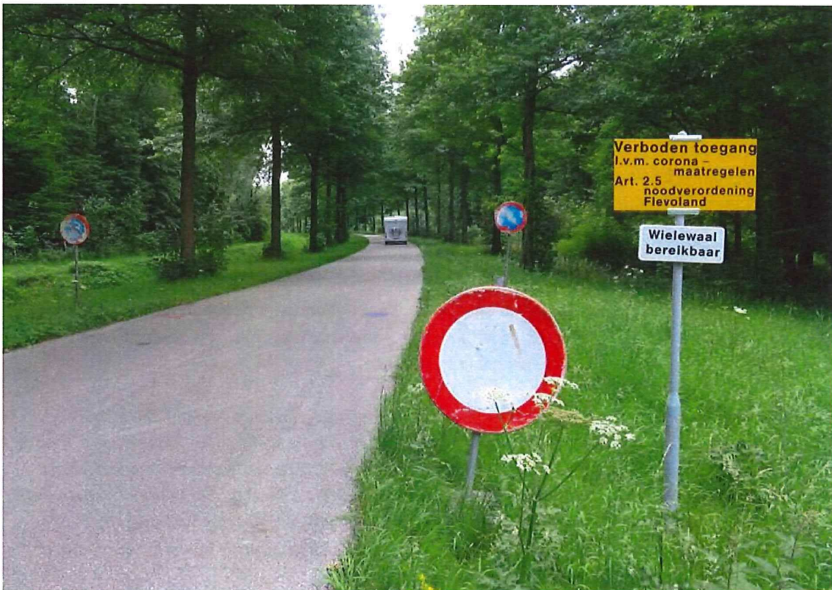
Figuur 3 De afsluiting van de parkeerplaats Wielewaal.

Uit meldingen in het gastenboek op mijn site en ook uit eigen waarneming is vastgesteld dat de parkeerplaats onbereikbaar is geweest gedurende het hele strandseizoen, zie Figuur 3.